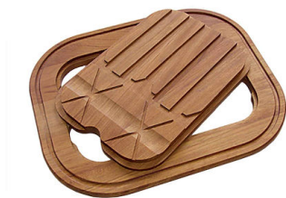
Planche de découpe Twin en bois Iroko 8644 003