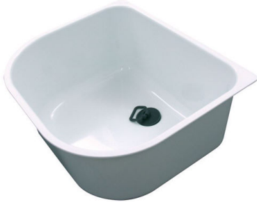
Cuvette blanche 8152 100