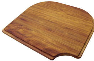
Planche de découpe en bois Iroko 8659 111