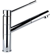
Mitigeur Lorenzo 8466 000