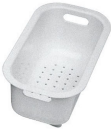
Passoire blanche 8151 100