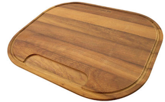
Planche de découpe en bois Iroko 8659 112